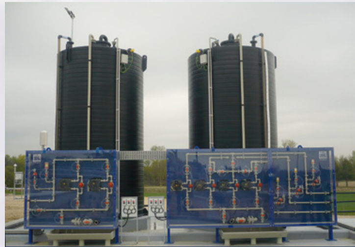
Panel dosificador de aditivos químicos Dosing Panel for chemical additives