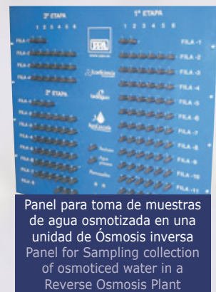
Panel para toma de muestras de agua osmotizada en una unidad de Ósmosis inversa Panel for Sampling collection of osmoticed water in a Reverse Osmosis Plant