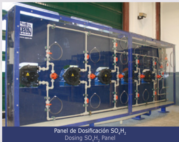
Panel de Dosificación \text{SO}_4\text{H}_2 Dosing \text{SO}_4\text{H}_2 Panel