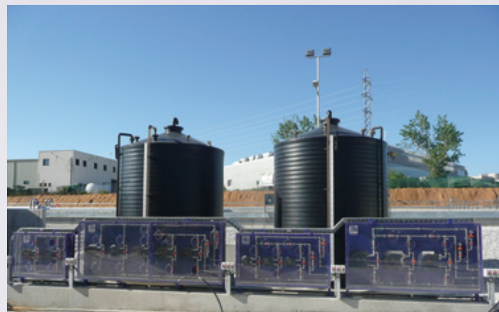
Panel de dosificación de productos químicos mediante bombas peristálticas Chemical products Dosing Panels with Peristaltic Pumps