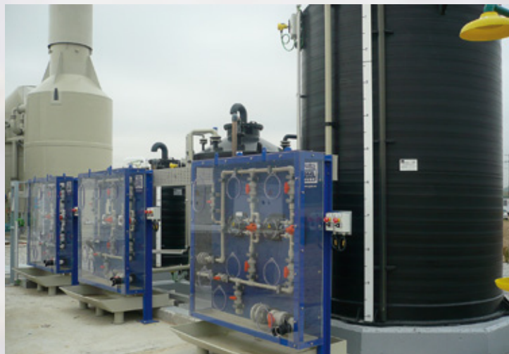
Dosificación de \text{SO}_4\text{H}_2 , \text{NaOH} y \text{ClONa} en una desodorización medioambiental Dosing of \text{SO}_4\text{H}_2 , \text{NaOH} y \text{ClONa} in a Deodorization Plant