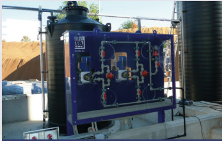
Panel dosificador de \text{NaOH} \text{NaOH} Dosing Panel