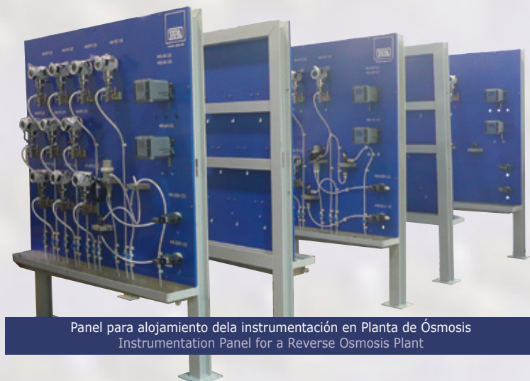
Panel para alojamiento de la instrumentación en Planta de Ósmosis Instrumentation Panel for a Reverse Osmosis Plant