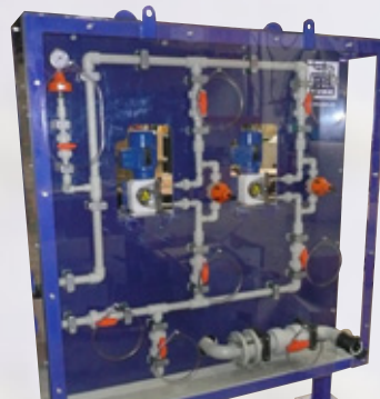
Panel de carga desde camión de \text{ClONa} Panel for discharge of \text{ClONa} from truck to storage Tank