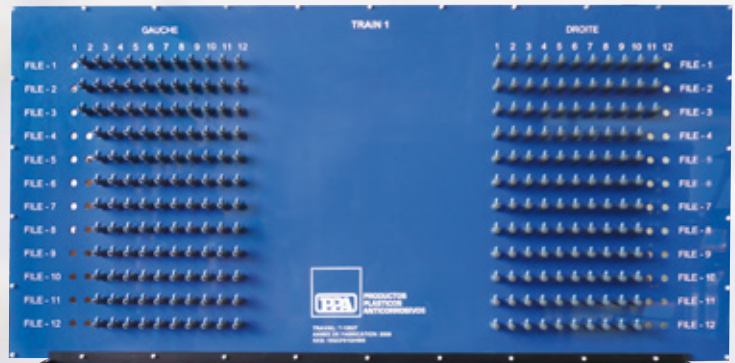
Toma de muestras osmosis inversa Toma de muestras osmosis inversa