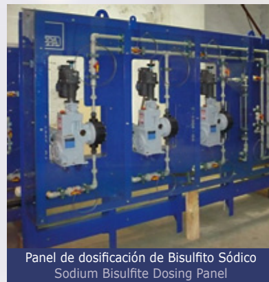
Panel de dosificación de Bisulfito Sódico Sodium Bisulfite Dosing Panel